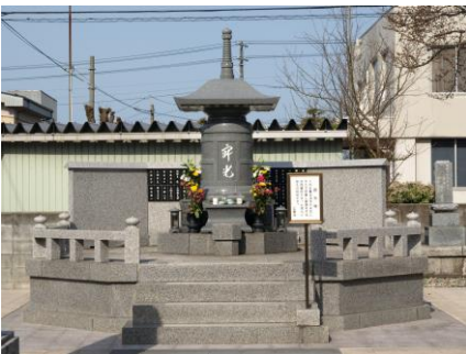
寂光塔(永代供養合同墓所)

寂光塔(永代供養墓地) 一人暮らしの方、お墓継承にお悩みの方、お寺が永代にわたり供養いたします。