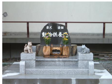
動物供養塔(ペットのお墓)

動物供養塔(ペット墓地) 動物のお骨を埋葬いたします。 檀家さん以外でも納骨供養できます。