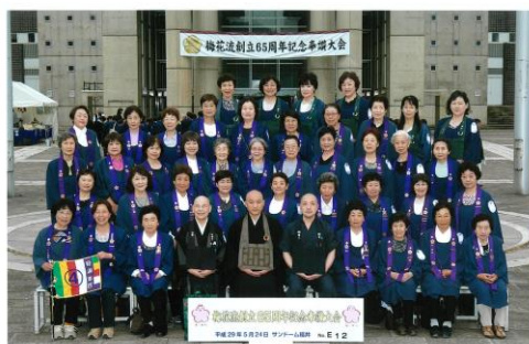
梅花流創立65周年記念奉讃大会 大本山永平寺報恩献詠 会場：サントーム福井 報日：平成29年5月24日・25日 主催：曹洞宗宗務庁

▼五月二十四日・二十五日福井県 鯖江ドームに於いて梅花流創立 六十五周年記念全国大会が開催 されました。開会式に先立ち新潟 県第四宗務所は二十三日永平寺 法堂にて「溪声」を奉詠、翌二十 四日会場を鯖江ドームに移して 開会式が行われました。新曲発表 は南こうせつ氏の作詞作曲によ る「澄みわたる空」でした。